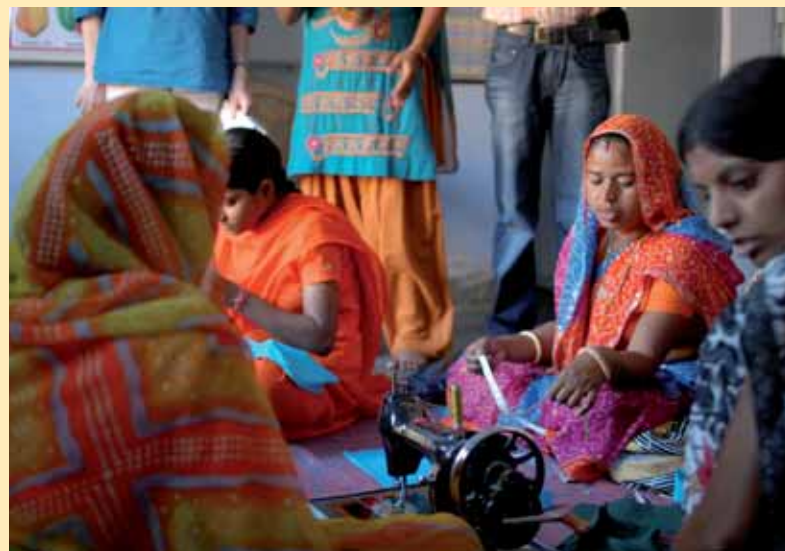
Academy for Working Children -koulun toimintaan kuuluvat myös aikuisten kurssit ja tulojen lisäämiseen tähtäävät säästöringit. Hanke saa myös Suomen ulkoministeriön kehitysyhteistyötukea.

Lue lisää UFF:n kehitysyhteistyökohteista: www.uff.fi/kehitysyhteistyö