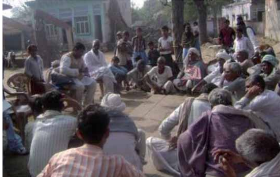
Kuva: Hanketta esitellään kyläkokouksessa Goya ka Baasissa.

Naisten ja lasten terveyteen ja elämänlaatuun biokaasun tuotannolla on kaikkein suurin merkitys. Perinteiseen tapaan ruokaa valmistetaan pienissä keittiöissä nuotiolla, jolloin puiden polttamisesta syntyvä savu täyttää koko keittiön. Ruoan valmistus avotulella on myös hidasta, jolloin savuisessa tilassa joudutaan viettämään tunteja joka päivä. Biokaasulla lämpeävä keittolevy ei savuta eikä pienhiukkasia pääse hengitysteihin. Biokaasuun siirtymisellä ehkäistäisiin Intiassa vuosittain 400.000-600.000 naisen ja lapsen pienhiukkasten aiheuttama ennenaikainen kuolema. Keittolevyn käyttö säästää myös aikaa, jolloin lapset pääsevät helpommin kouluun.